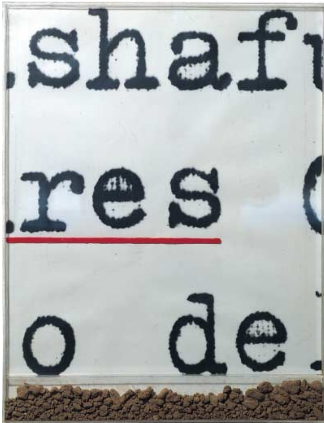
SHAF RES O DE - 1978 plexiglas, acrilici, terra di Campo Tures, cm. 65x50 - coll. dell' Autore